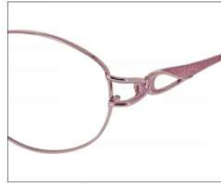
No.2 F: ピンク T: ピンク