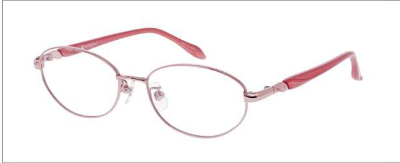
No.2 F: ピンク T: パールピンク

YK398 材質 F:チタン T:CP 52□16-135 ↓35.0 00260