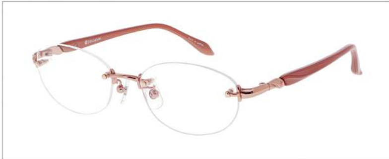
No.1 F: ピンクオレンジ T: パールピンクベージュ

YK400 材質 F:チタン T:CP 51□17-135 ↓35.4 00260