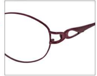
No.3 F: ワイン T: ワイン