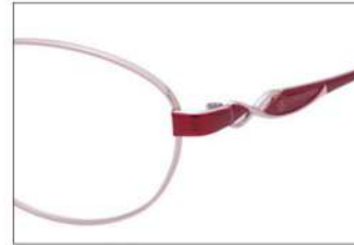
No.2 ピンク / ワイン