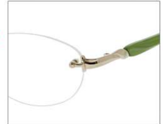
No.3 F: ライトゴールド T: パールライトグリーン