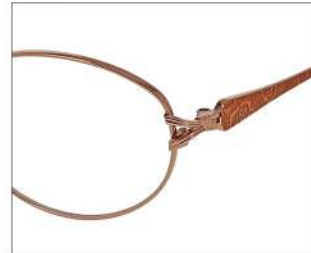
No.1 F: オレンジ T: オレンジ/オレンジゴールド