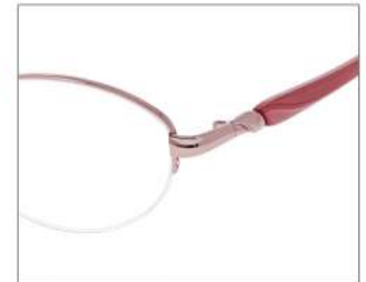
No.2 F: ピンク T: パールピンク

YK400 材質 F:チタン T:CP 51□17-135 ↓35.4 00260