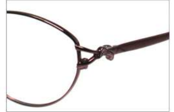
No.5 F: ワイン T: ワインマット(印刷)