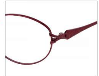
No.3 F: ローズ T: ローズ/チェリーレッド