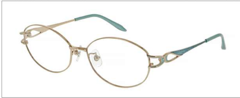
No.1 F: ゴールド T: ゴールド/グレイッシュミント