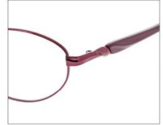
No.3 F: ワイン T: パールワイン

YK399 材質 F:チタン T:CP 51□17-135 ↓35.3 00260