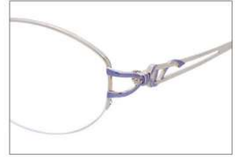
No.3 ホワイトゴールド

YK359 材質F:チタンT:βチタン 52□17-135 ↑37.1 00250