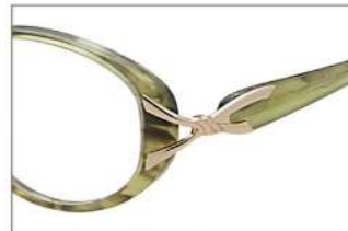
No.1 カーキグリーンササ