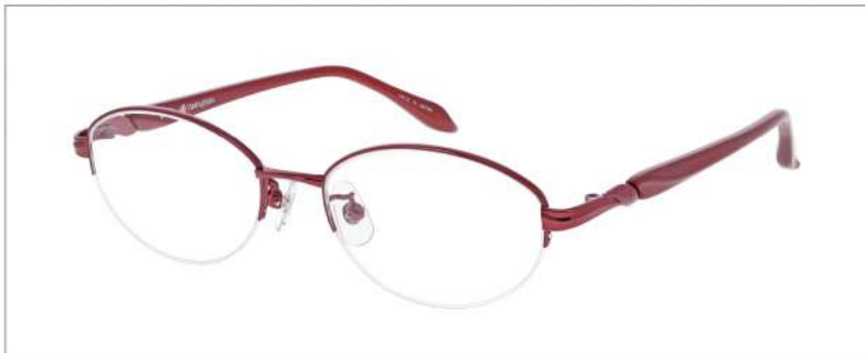
No.3 F: ローズ T: パールローズ

YK399 材質 F:チタン T:CP 51□17-135 ↓35.3 00260